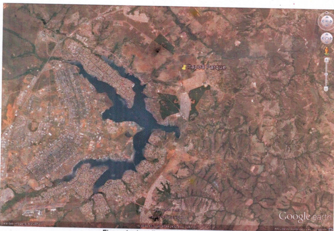
Figura 1 – Localização do Itapoã parque