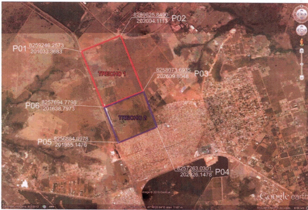
Figura 2 – Localização das áreas de estudo